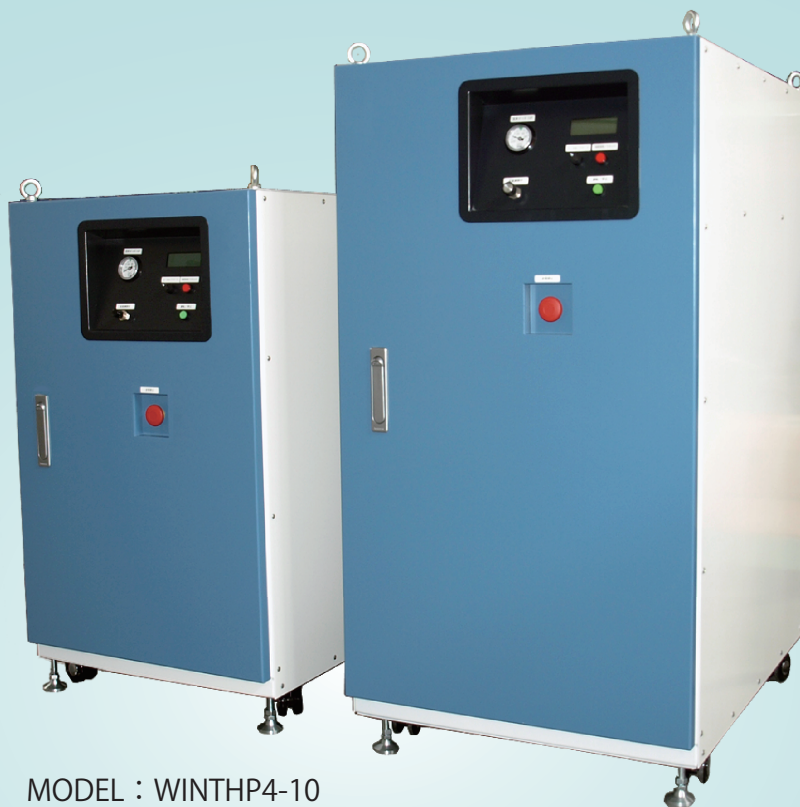
MODEL : WINTHP4-10 (0.75kW 内蔵)